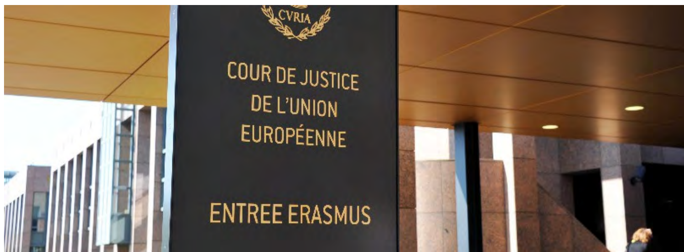
the European Court of Justice on Kirchberg Plateau in Luxembourg

Apžvalga su muitinės sritimi susijusių teisės aktų ir pranešimų, paskelbtų ES oficialiajame leidinyje, taip pat informacijos, kurią skelbia Europos Komisija, ES šalių muitinės, Pasaulio muitinių organizacija ir Pasaulio prekybos organizacija. Atnaujinama kas savaitę!